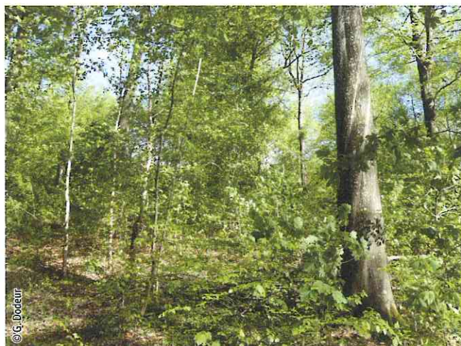
Hêtraie à aspérule

Un habitat Natura 2000 est un milieu rare, menacé ou remarquable à l'échelle européenne. En Wallonie, ces habitats sont regroupés en unités de gestion (UG) nécessitant des mesures 1 pour les maintenir dans un état de conservation favorable. La liste des principaux habitats Natura 2000 présents dans ce site sont: