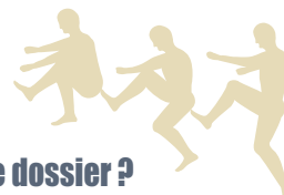
Tableau des revenus du ménage à prendre en considération